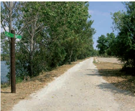
CAMINO QUE RECORRE EL ENTORNO DEL RÍO FLUVIÀ

El Consejo Comarcal de la Alta Ribagorça llevó a cabo un inventario de los caminos ganaderos y de trashumancia de la comarca para conservar esta red como un elemento patrimonial, paisajístico y ambiental. El objetivo es que cada municipio garantice la recuperación y preservación de los mismos.