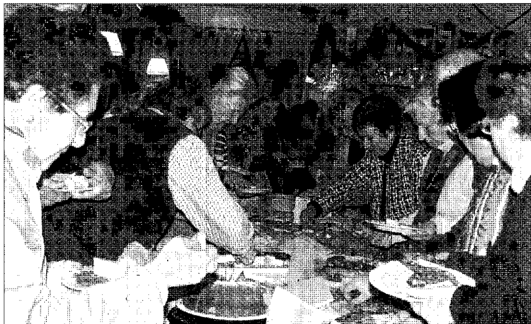
MUESTRA. Los mayores del Rocío y Matalascañas se reunieron en el campo de golf.

El pasado lunes 15 de diciembre, tuvo lugar la Muestra de Dulces elaborados por los mayores de la aldea y de la playa almonteña, acto que se desarrolló en el comedor del Campo de Golf "Dunas de Doñana" de Matalascañas.